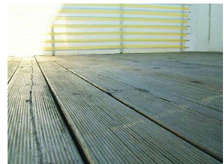
Terrasse protégée après 1 an d'exposition

Produit dangereux – respecter les précautions d'emploi. Avant toute utilisation, lisez l'étiquette et les informations concernant le produit. Les informations contenues dans nos documentations ne doivent en aucun cas se substituer aux essais préliminaires qu'il est indispensable d'effectuer pour vérifier l'adéquation des produits à chaque cas déterminé. Lire impérativement l'étiquette, la fiche technique et la fds avant chaque utilisation. La présente édition annule et remplace toute fiche technique antérieure relative au même produit.