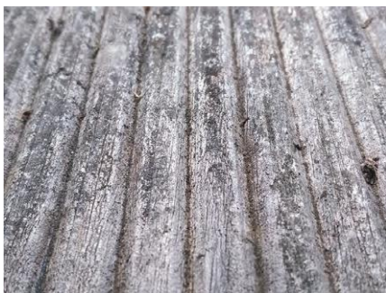
Lame terrasse 3 ans exposition naturelle